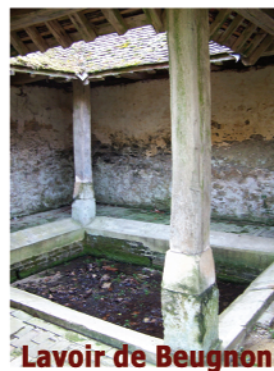
Lavoir de Beugnon