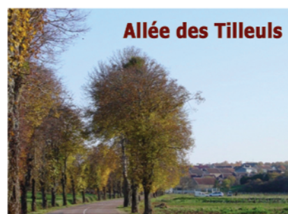
Allée des Tilleuls