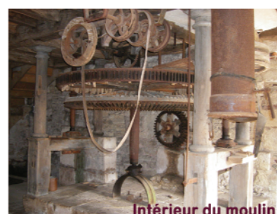
Intérieur du moulin